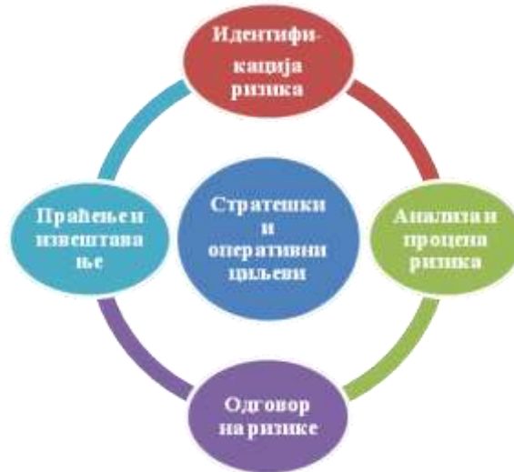
Слика 1. Процес управљања ризицима

Процес управљања ризицима састоји из четири основна корака која се примењују и на стратешке и на оперативне ризике: 1) идентификација ризика; 2) анализа и процена ризика; 3) одговор на ризике; и 4) праћење и извештавање.